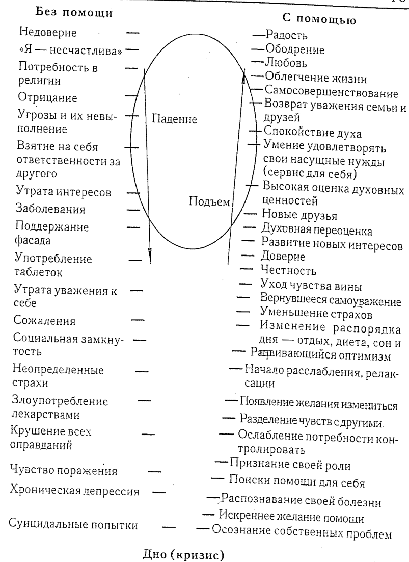
Рис. 2. Схема динамики созависимости.

Б. Поддерживайте хорошую физическую форму.