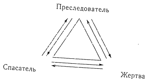
Рис. 1. Драматический треугольник С. Карпмана, или треугольник власти

«Спасая» своего близкого, созависимые неизбежно подчиняются закономерностям, известным в литературе под названием «Драматический треугольник С. Карпмана» [42,43].